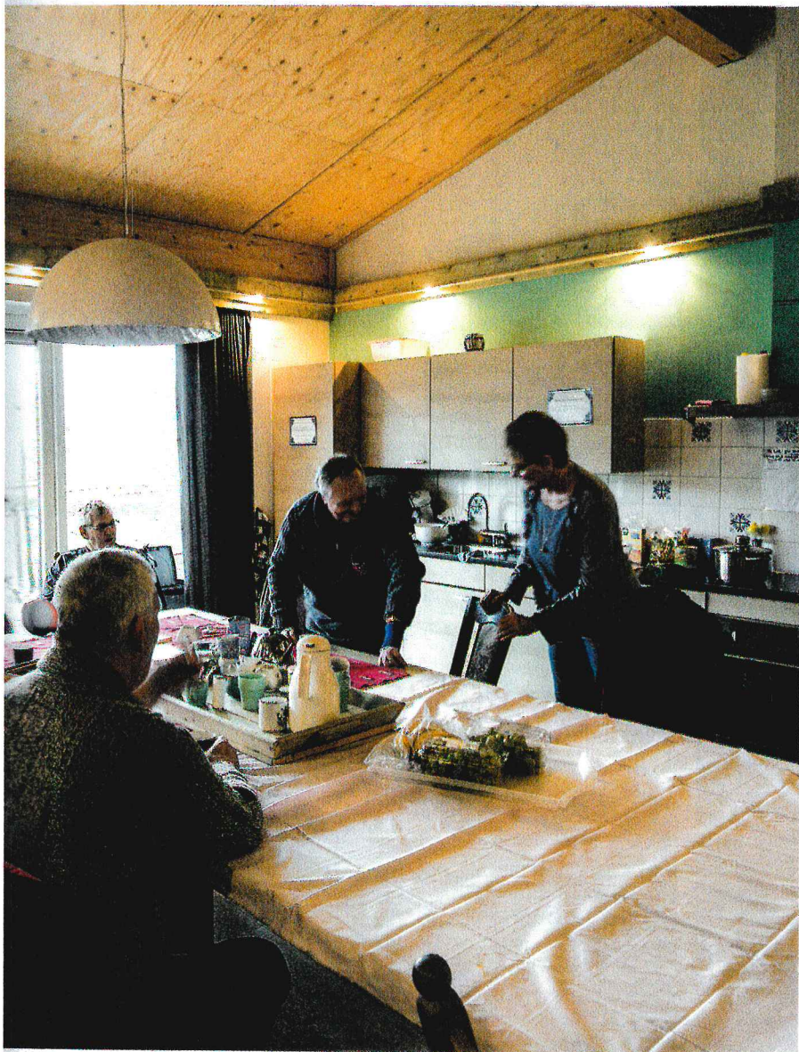
1 Bewoners schuiven aan voor de gezamenlijke lunch